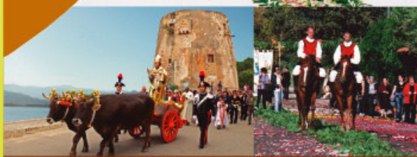
Estrazione biglietti della lotteria il Sabato 26 giugno 2010