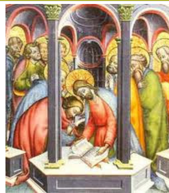
Immagine di uno scambio che, da lì a poco, sarà per ogni uomo. La vicenda di Lazzaro, allora, è la vicen-

La resurrezione di Lazzaro è posta poco prima della Passione di Gesù. È l'ultimo e il più clamoroso dei segni, quello che determina la decisione, da parte del Sinedrio, della pericolosità di Gesù e la necessità di un suo immediato arresto, senza indugiare ulteriormente. Come se Giovanni volesse dirci che la vita di Lazzaro determina la morte di Gesù.